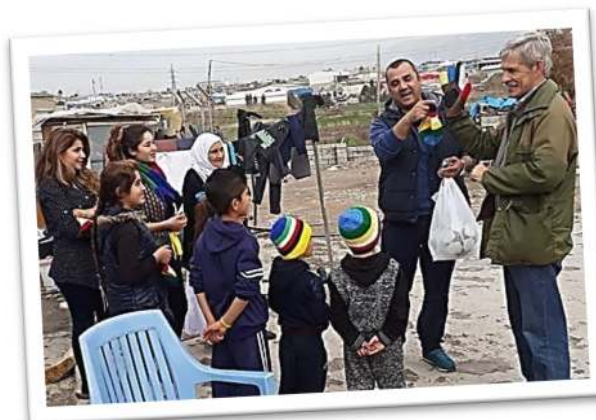
Vertel stories aan kinders